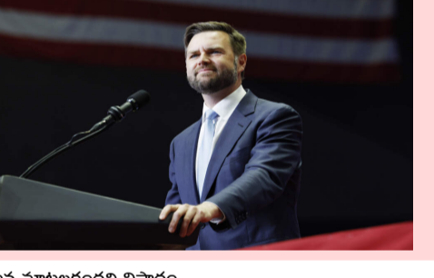
కుమ్మర ఫుటన మాటలకందరి విషాదం ఈ కేసులో హంతకులను కాపాడటం సిగ్గుచేటు జిందానీ వర్షం ప్రసిడెంట్ కేటీఆర్ పైర్

పశ్చిమాసియాలో యుద్ధ మేఘాలు కమ్ముకుంటున్న వేళ.. అమెరికా-ఇరాన్ మధ్య మాటల యుద్ధం ముదిరింది. ఒకవైపు యుద్ధనౌకలను మొహరిస్తూ టిప్రోస్ పై ఒత్తిడి పెంచుతున్న అర్రాబ్జం.. మరొకవైపు దౌత్యపరమైన హెచ్చరికలతో ఇరాన్ పాలకుల గుండెల్లో రైళ్లు పరిగెత్తిస్తోంది. పశ్చిమాసియాలో యుద్ధ మేఘాలు కమ్ముకుంటున్న వేళ.. అమెరికా-ఇరాన్ మధ్య మాటల యుద్ధం ముదిరింది. ఒకవైపు యుద్ధనౌకలను మొహరిస్తూ టిప్రోస్ పై మిగతా 2లో