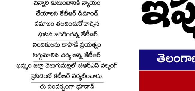
ఖమ్మం జిల్లా వెలుగుమట్టిలో బీఆర్ఎస్ వర్కింగ్ ప్రెసిడెంట్ కేటీఆర్ పర్యటించారు. ఈ సందర్భంగా భూదాన్ భూ బాధితులను కలిసి చరామర్చించారు. అనంతరం మీడియాతో మాట్లాడారు. ఇదే స్థలంలో మా ప్రభుత్వం వచ్చిన తర్వాత మీకు ఇల్లు కట్టిస్తాం.. ఇది నా బాధ్యత అని మిగతా 2లో

తెలంగాణలో హత్యా రాజకీయాలు జరుగుతున్నాయి పసిగుడ్డు పం పాపం చేసింది? బాధిత కుటుంబంతో కలిసి మాట్లాడుతున్న కేటీఆర్ ఖమ్మం జిల్లా వెలుగుమట్టిలో బీఆర్ఎస్ వర్కింగ్ ప్రెసిడెంట్ కేటీఆర్ పర్యటించారు. ఈ సందర్భంగా భూదాన్ భూ బాధితులను కలిసి చరామర్చించారు. అనంతరం మీడియాతో మాట్లాడారు. ఇదే స్థలంలో మా ప్రభుత్వం వచ్చిన తర్వాత మీకు ఇల్లు కట్టిస్తాం.. ఇది నా బాధ్యత అని మిగతా 2లో