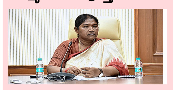
కుమ్మర ఫుటన మాటలకందరి విషాదం ఈ కేసులో హంతకులను కాపాడటం సిగ్గుచేటు జిందానీ వర్షం ప్రసిడెంట్ కేటీఆర్ పైర్