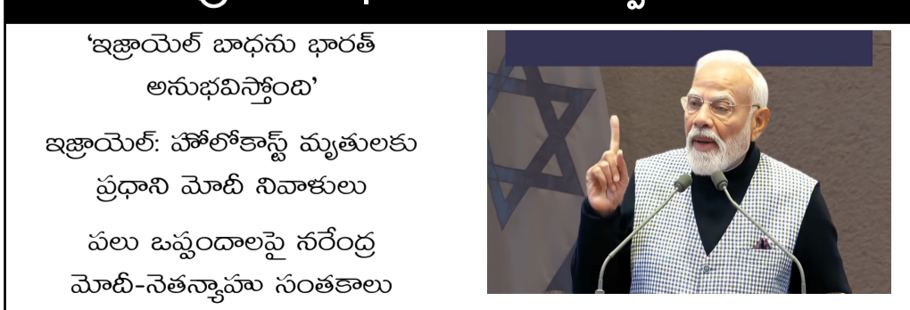
ఇజ్రాయెల్ తో భారత్ పలు కీలక ఒప్పందాలు చేసుకుంది. పలు ఒప్పందాలపై సరేంద్ర మోదీ-నెతన్యాహు సంతకాలు చేసుకున్నారు. ఇజ్రాయెల్ ప్రధానితో సరేంద్ర మోదీ కీలక సమావేశం నిర్వహించారు. భారత్ లో పర్యటించాలని నెతన్యాహును ప్రధాని మోదీ ఆహ్వానించారు. మిగతా 2లో

ఇజ్రాయెల్ తో భారత్ పలు కీలక ఒప్పందాలు 'ఇజ్రాయెల్ బాధను భారత్ అనుభవిస్తోంది' ఇజ్రాయెల్: హోలోకాస్ట్ మ్యూజియం ప్రధాని మోదీ నివాళులు పలు ఒప్పందాలపై సరేంద్ర మోదీ-నెతన్యాహు సంతకాలు చేసుకున్నారు. ఇజ్రాయెల్ ప్రధానితో సరేంద్ర మోదీ కీలక సమావేశం నిర్వహించారు. ఇజ్రాయెల్ తో భారత్ పలు కీలక ఒప్పందాలు చేసుకుంది. పలు ఒప్పందాలపై సరేంద్ర మోదీ-నెతన్యాహు సంతకాలు చేసుకున్నారు. ఇజ్రాయెల్ ప్రధానితో సరేంద్ర మోదీ కీలక సమావేశం నిర్వహించారు. భారత్ లో పర్యటించాలని నెతన్యాహును ప్రధాని మోదీ ఆహ్వానించారు. మిగతా 2లో