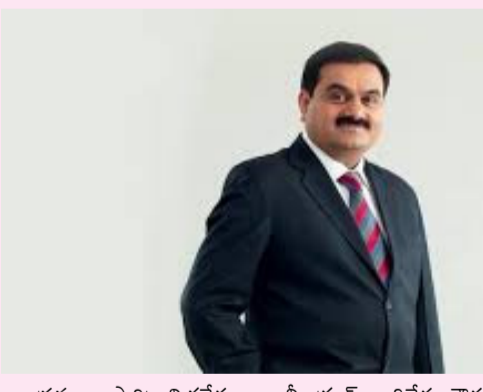
ప్రముఖ పారిశ్రామికవేత్త, అదానీ గ్రూప్ అధినేత గౌతమ్ వజ్రాల ట్రేడింగ్ కంపెనీలో చేరి మూడేళ్లలోనే ఆ వ్యాపారంలోని

అదానీ తన వ్యాపార, పారిశ్రామిక ప్రస్థానాన్ని విద్యార్థులతో పంచుకున్నారు. జీవిత అనుభవాలతోనే ఎవరికైనా వివేకం వస్తుందన్నారు. విజ్ఞానం మాత్రం బాగా చదివితేనే వస్తుందన్నారు. హైదరాబాద్లో అదానీ గ్రూప్ ఏర్పాటు చేసిన అదానీ ఇంటర్నేషనల్ స్కూల్ విద్యార్థులను ఉద్దేశించి మాట్లాడుతూ ఆయన ఈ జీవిత సత్యాలు చెప్పారు. కాలేజీ మానేసి 16 ఏళ్ల వయసులో కేవలం రైలు టిక్కెట్లకు సరిపడా డబ్బులతో ముంబై చేరిన తాను ఎన్ని కష్టాలు పడింది వివరించారు. చిన్న వయసులోనే బితుకుదెరువు కోసం ముంబై చేరడం, అక్కడ ఒక