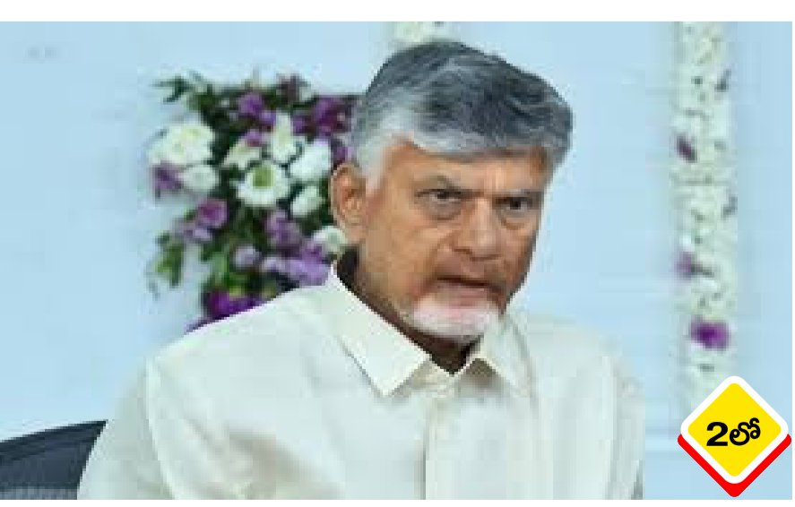
ఆంధ్రప్రదేశ్లో కూటమి ప్రభుత్వం అధికారంలోకి వచ్చిన తర్వాత గత 20 నెలల కాలంలో సాధించిన ప్రగతిని, భవిష్యత్ కార్యాచరణను ముఖ్యమంత్రి చంద్రబాబు శాసనసభ వేదికగా వివరించారు. రాష్ట్రంలో పెట్టుబడులు, మౌలిక సదుపాయాలు, బిటీ, ఉద్యోగ కల్పన, వైద్య, విద్య తదితర

▶ సీఎం చంద్రబాబు ▶ అసెంబ్లీలో సీఎం చంద్రబాబు ప్రసంగం ▶ గత పాలనలో పారిశ్రామిక విధ్వంసం.. ఇప్పుడు స్వీట్ ఆఫ్ డూయింగ్ బజినెస్ అని వివరణ ▶ పీవీఐ విధానంలో మెడికల్ కాలేజీల నిర్మాణం ▶ ఏపీకి క్యూ కడుతున్న ప్రపంచ స్థాయి సంస్థలు ▶ గత ప్రభుత్వ హయాంలో ఎక్సైజ్ శాఖలో భారీ కుంభకోణం ▶ పర్యాటక రంగానికి పరిశ్రమ హోదా కల్పిస్తూ నిర్ణయం