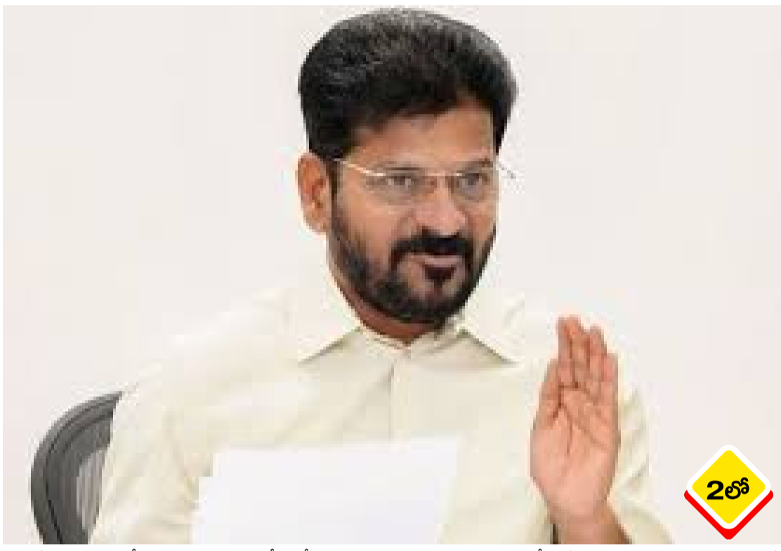
కార్యక్రమాన్ని ఆమలు చేయడంపై ఆయన దిశానిర్దేశం చేశారు. గ్రామ సర్పంచులు, మున్సిపల్ చైర్మన్లు, మేయర్లు, ఎమ్మెల్యేలు, ఎమ్మెల్యేలు, ఎంపీల భాగస్వామ్యంతో ఈ ప్రణాళికను విజయవంతం చేయాలని సీఎం రేవంత్ కోరారు. ఇందులో భాగంగా కొత్తగా ఎన్నికైన ప్రజాప్రతినిధులకు ఈ నెల 12న జిల్లా కేంద్రాల్లో ప్రత్యేక శిక్షణ కార్యక్రమం ఏర్పాటు చేయాలని నిర్ణయించారు.

సీఎం రేవంత్ ▶ నకిలీ ఉద్యోగులను సృష్టించిన ఏజెన్సీలపై ఆడిట్ చేసి కేసులు పెట్టాలని ఆదేశం ▶ మార్చి 6 నుంచి 99 రోజుల పాటు 'ప్రజాపాలన-ప్రగతి ప్రణాళిక' కార్యక్రమం ▶ ఇసుక మాఫియా, అక్రమ మైనింగ్పై కఠినంగా లేకుంటే కలెక్టర్లపై చర్యలని హెచ్చరిక రాష్ట్రంలో సుమారు 25 వేల మంది బోగస్ ఉద్యోగులు ఉన్నారని, వారంతా కనీసం ఆధార్ కార్డు కూడా లేకుండా ఏళ్లుగా జీతాలు తీసుకుంటున్నారని సీఎం రేవంత్ రెడ్డి సంచలన విషయం వెల్లడించారు. రాష్ట్రవ్యాప్తంగా వివిధ శాఖల్లో ఉన్న 1.70 లక్షల మంది బెటినోర్నింగ్, కాంట్రాక్టు ఉద్యోగుల్లో ఈ నకిలీ ఉద్యోగులను గుర్తించినట్లు తెలిపారు. ఇలాంటి బోగస్ ఉద్యోగులను సృష్టించి ప్రభుత్వ ధనాన్ని దుర్వినియోగం చేస్తున్న బెటినోర్నింగ్ ఏజెన్సీలపై సమగ్ర ఆడిట్ చేయించి, క్రిమినల్ కేసులు నమోదు చేయాలని ఆర్థిక శాఖ అధికారులను ఆయన తీవ్రంగా ఆదేశించారు. కలెక్టర్లు ఈ విషయంలో అప్రమత్తంగా ఉండాలని సూచించారు మంగళవారం సచివాలయంలో జిల్లా కలెక్టర్లతో సీఎం రేవంత్ రెడ్డి ఉన్నతస్థాయి సమావేశం నిర్వహించారు. మార్చి 6 నుంచి జూన్ 12 వరకు 99 రోజుల పాటు 'ప్రజాపాలన-ప్రగతి ప్రణాళిక'