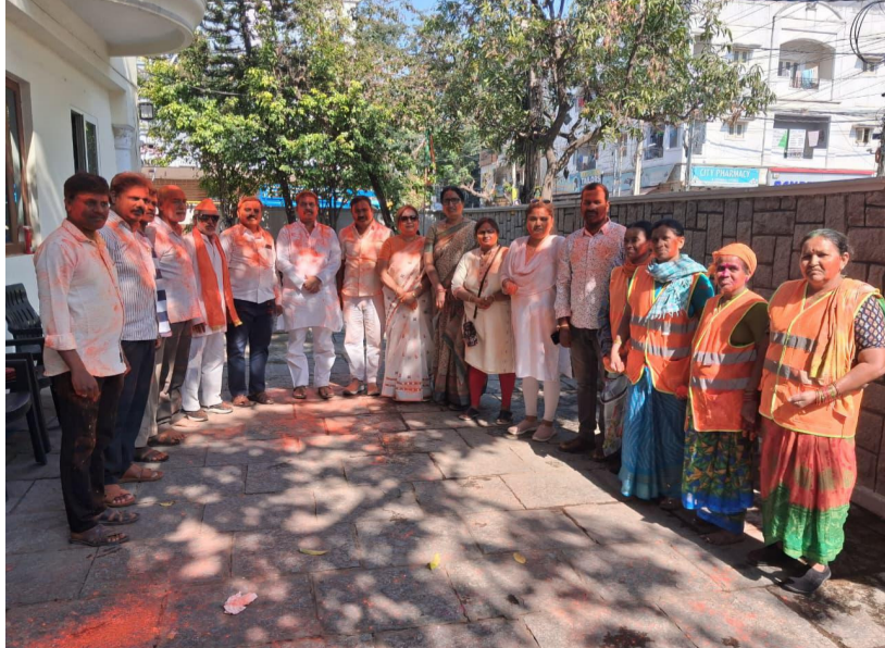
కార్యక్రమంలో నాయకులు, కార్యకర్తలు ఒకరికి ఒకరు రంగులు చల్లుకుంటూ, మిఠాయిలు పంచుకుంటూ సంతోషంగా వేడుకలను నిర్వహించారు.

మెళకువలు ఆకలింపు చేసుకుని వజ్రాల ట్రేడింగ్ కోసం సొంత బ్రోకరేజీ సంస్థను ఏర్పాటు చేసిన విద్యానాన్ని వివరించారు. ఈ బ్రోకరేజీ వ్యాపారంలో 1981లో 19 ఏళ్ల వయసులో తొలి ట్రేడింగ్లోనే రూ.10,000 కమీషన్ సంపాదించిన విషయాన్ని ఆయన వెల్లడించారు. 'ఒక జపాన్ కొనుగోలుదారుడితో నేను జరిపిన మొదటి ట్రేడింగ్ నాకు ఇంకా గుర్తుంది. ఆ తొలి ట్రేడింగ్లోనే నాకు రూ.10,000 కమీషన్ లభించింది. అప్పుడు నా వయసు 19 సంవత్సరాలు. ఒక బిజినెస్ వ్యాపారవేత్తగా అది నా తొలి ప్రయాణం' అన్నారు. అంచెలంచెలుగా ఎదిగా: ఆ తరువాత అమ్మదాదాదాకా తిరిగి వచ్చి తన అన్న కొనుగోలు చేసిన ఒక చిన్న పీవీసీ ఫిట్ ఫ్యాక్టరీ నడవడంలో సహాయ పడడం, 1988లో సొంతంగా అదానీ ఎక్స్పోర్ట్స్ పేరుతో కమోడిటీస్ ట్రేడింగ్ సంస్థను ఏర్పాటు చేసి, అంచెలంచెలుగా ఎలా వివిధ వ్యాపారాల్లో ఎదిగింది అదానీ విద్యార్థులకు వివరించారు. జీవితంలో ఎన్ని అవకాశాలు, ఎదురుదెబ్బలు తగిలినా ఎదగాలేనే లక్ష్యం నుంచి నీరూరిం పోవద్దని విద్యార్థులను కోరారు. జీవితంలో ఎదగాలని కలలు కనడం సంపాదకుల మాత్రమే పరిమితమైన సొత్తు కారణంగా.