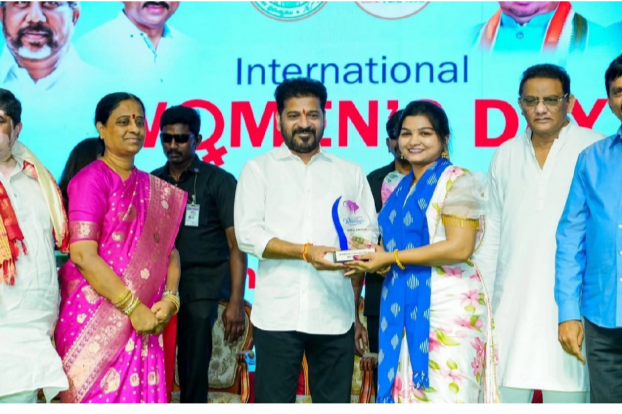
కమల సూన్, హైదరాబాద్, మార్చి 08 : హైదరాబాద్ లోని కాలిఫర్నియా నగరంగా మార్పుతున్నట్లు ముఖ్యమంత్రి రేవంత్ రెడ్డి తెలిపారు. రెడ్, ఆరెంజ్ కేటగిరి పరిశ్రమలను ఓఆర్ఆర్ బయటకు పంపిస్తామని చెప్పారు. ప్రజాభివృద్ధిలో నిర్వహించిన మహిళా దినోత్సవ కార్యక్రమంలో పాల్గొన్న సీఎం రేవంత్, డిప్యూటీ సీఎం భట్టి, మంత్రులు, ఈ సందర్భంగా మహిళా జర్నలిస్టులకు సన్మానం చేశారు. మహిళలు యజమానులూ ఉన్నారు : మహిళా జర్నలిస్టులకు ప్రత్యేక గుర్తింపు ఇస్తున్నామని రేవంత్ రెడ్డి తెలిపారు. దేశంలోని ఏ పదవైనా మహిళలకు ఇచ్చిన పార్టీ కాంగ్రెస్ అని, ఉక్కు మహిళ సంకల్పంతోనే తెలంగాణ రాష్ట్రం ఏర్పడిందని, మహిళలకు సరైన గుర్తింపు ఇవ్వాలని ప్రజాప్రభుత్వం నిర్ణయించిందని అన్నారు. - మిగతా 2 లో