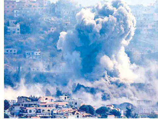
రిమాట్ కంట్రోల్ పేలుళ్లతో ఇండ్లు ధ్వంసం చేస్తున్న ఐడీఎఫ్ జెరూసలేం : సీట్ ఫైర్ తర్వాత అమెరికా-ఇరాన్ మధ్య

దాడులు ఆగినా.. ఇజ్రాయెల్ మాత్రం లెబనాన్ ను పదిలిపెట్టడం లేదు. ముఖ్యంగా దక్షిణ లెబనాన్లోని మొత్తం గ్రామాలను ఒక క్రమ వర్ణితో నామరూపాలేకుండా తుడిచిపెట్టేస్తుంది. బాంబులు, పేలుళ్లతో అక్కడను ఇండ్లు, భవనాలను కూల్చేస్తున్నది. దీనిపై 'గార్డయన్' కథనం ప్రకారం, ఇండ్లకు పేలుడు పదార్థాలను అమ్మి, వాటిని రిమాట్ కంట్రోల్ ద్వారా పేల్చేస్తున్నది. తెజ్, సఖోరా, దేరేసర్కాన్ సరిహద్దు గ్రామాల్లో సామాజిక పేలుళ్లు జరుపుతున్నట్లు ఇజ్రాయెల్ సైన్యం మూడు వీడియోలను విడుదల చేసింది. దక్షిణ లెబనాన్ సరిహద్దు ప్రాంతాల్లో ఈ విధ్వంసం కొనసాగుతున్నట్లు మీడియాలో కథనాలు వెలువడ్డాయి. దక్షిణ లెబనాన్ పై శనివారం నాటి దాడుల్లో 18 మంది చనిపోయారు. లెబనాన్లో శాంతి చర్యలు, ఒప్పందం హెచ్చింపులకు వర్తించదని