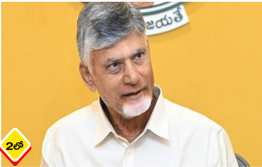
అమరావతి రాజధాని కోసం భూములిచ్చిన రైతులకు జీవనోపాధికి భరోసా కల్పిస్తూ వార్షిక కౌలును ఆంధ్రప్రదేశ్ ప్రభుత్వం శుభవార్త అందించింది. వారి గణనీయంగా పెంచుతూ కీలక నిర్ణయం