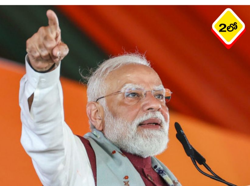
పశ్చిమ బెంగాల్ లో అధికార తృణమూల కాంగ్రెస్ కు వ్యతిరేకంగా దండెత్తింది బీజేపీ కాదని... రాష్ట్రంలోని మహిళలు, యువత చురుకైన పోరాటాన్ని ప్రారంభించారని ప్రధానమంత్రి