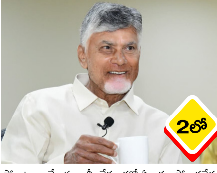
పోరాటాలు చేశాను కానీ, నేరగాళ్లతో ఏనాడూ పోరాడలేదు. ప్రస్తుత పరిణామాల్లో క్రిమినల్స్ తో రాజకీయం చేయాల్సిన పరిస్థితి రావడం నాకు కూడా కొత్తగానే ఉంది" అంటూ ముఖ్యమంత్రి, టీడీపీ అధినేత

అనంతబాబు ఉదంతాలను ప్రస్తావిస్తూ క్యాడర్ను అప్రమత్తం చేసిన సీఎం ➤ కార్యకర్తలే టీడీపీకి అధినేతలని, ప్రతి ఒక్కరూ నాయకుడిగా ఎదగాలని పిలుపు ➤ వైసీపీ విధ్వంసాన్ని ప్రజలకు గుర్తుచేస్తూ, ప్రభుత్వం చేస్తున్న మంచినీ వివరించాలని దిశానిర్దేశం "నా సుదీర్ఘ రాజకీయ జీవితంలో ఎన్నో రాజకీయ