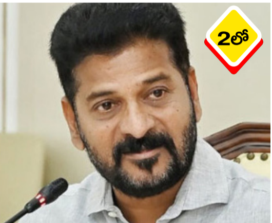
సర్కంపేట ఆర్టీసీ డిపోకు చెందిన డ్రైవర్ శంకర్ గౌడ్ మృతి పట్ల తెలంగాణ ముఖ్యమంత్రి రేవంత్ రెడ్డి తీవ్ర దిద్దాంతి