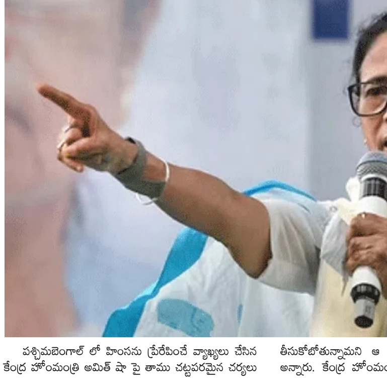
పశ్చిమబెంగాల్ లో హింసను ప్రేరేపించే వ్యాఖ్యలు చేసిన కేంద్ర హోంమంత్రి అమిత్ షా పై తాము చట్టపరమైన చర్యలు

వ్యాఖ్యలు చేయడం కరెక్ట్ కాదని ఆమె అన్నారు. హోంమంత్రి వ్యాఖ్యలు హింసను ప్రేరేపించేవిగా ఉన్నాయని విమర్శించారు. అలాంటి వ్యాఖ్యలతో బెంగాల్ లో గెలువాలనుకుంటే ఎప్పుడీ గెలువలేదని స్పష్టం చేశారు. బెంగాల్ ప్రజలు అలాంటి వ్యాఖ్యలను ఏమాత్రం అంగీకరించరని చెప్పారు. హుగ్లీ జరిగిన ఎన్నికల ప్రచారనభటో మమతాబెనర్జీ ప్రసంగించారు. ఈ సందర్భంగా శుక్రవారం కేంద్రహోంమంత్రి చేసిన వ్యాఖ్యలపై ఆమె మండిపడ్డారు. శుక్రవారం ఎన్నికల ప్రచార సభలో కేంద్ర హోంమంత్రి మాట్లాడుతూ.. అసెంబ్లీ ఎన్నికల తర్వాత బెంగాల్ లోని డిఎస్ గూండాలను తలకిందులుగా చేయాలని వ్యాఖ్యానించారు. ఈ వ్యాఖ్యలను మమత తీవ్రంగా తప్పుపట్టారు. ఆయనపై చట్టపరమైన చర్యలు తీసుకుంటామని హెచ్చరించారు. కాగా పశ్చిమబెంగాల్ లోని మొత్తం 294 అసెంబ్లీ స్థానాలకు రెండు విడతల్లో ఎన్నికలు నిర్వహిస్తున్నారు. ఏప్రిల్ 23న తొలి విడత ఎన్నికల పోలింగ్ పూర్తయ్యింది. ఏప్రిల్ 29న రెండో విడత పోలింగ్ జరుగుతుంది. మే 4న ఓటమి లెక్కించి ఫలితాలను వెల్లడించనున్నారు. బెంగాల్ లో అధికార తృణమూల కాంగ్రెస్, ప్రతిపక్ష బీజేపీ మధ్యనే ప్రధాన పోటీ నెలకొంది. గతంలో దశాబ్దాల తరబడి బెంగాల్ ను ఏలిన వామపక్షాలు ఇప్పుడు నామమాత్ర పోలింగ్ మారిపోయాయి.