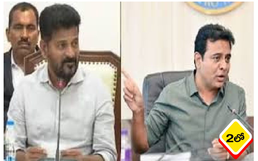
'మూడు ఫీట్లు ఉన్నాడు కూడా తెలంగాణ తొలి రెడ్డి పై బీఆర్ఎస్ పార్టీ వర్కింగ్ ప్రెసిడెంట్ కేటీఆర్ సీఎం కేసీఆర్ పై మాట్లాడుతున్నాడు' అని రేవంత్ రెడ్డి పై బీఆర్ఎస్ పార్టీ వర్కింగ్ ప్రెసిడెంట్ కేటీఆర్ తీవ్ర ఆగ్రహం వ్యక్తం చేశారు.