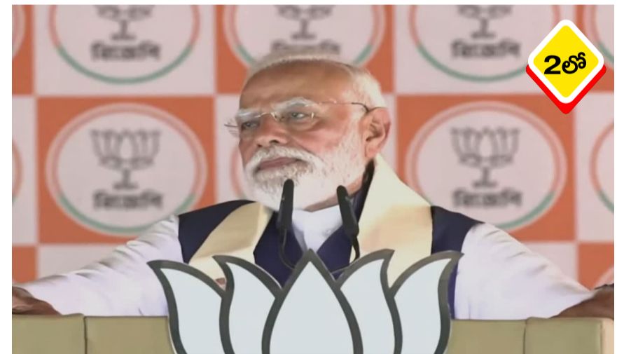
మహిళలపై అత్యాచారాలు, హింసకు పాల్పడే దుర్మార్గులను మే 4 తర్వాత అధికారికంగా శిక్షిస్తామని మోదీ ప్రధాని నరేంద్ర మోదీ అన్నారు.