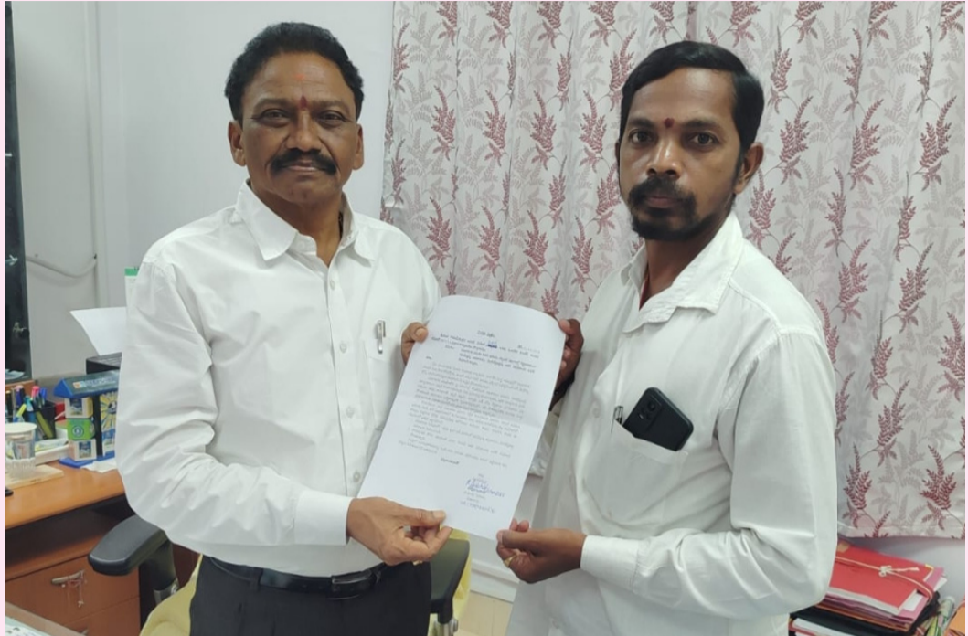
ఏరియాలకు ట్రాన్స్ఫర్ చేయాలని మణుగూరు ఏరియాకు మోక్షం లభించే దిశగా ఉన్న అధికారులను దృష్టి పెట్టాలని ఆయన కోరారు. మణుగూరు ఏరియాలో కన్వినెన్స్ వాహనాల దుబారా కూడా అరికట్టాలని సంస్థకు ఆర్థిక నష్టం తగ్గించాలని ఏరియా జిఎం సివిల్ కార్యదర్శి, స్పందించడంతో సిఎంఓ, డైరెక్టర్లకు ఫిర్యాదు చేస్తారని తెలిపారు.