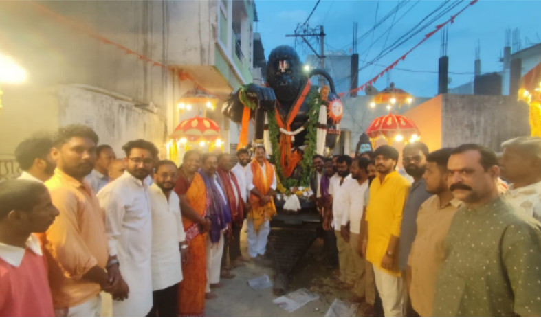
అల్లూపూర్, మే 12 ( హంసకలం వార్త )

అల్లూపూర్ డివిజన్ పరిధిలోని రాజీవ్ గాంధీ నగర్ ప్రాంతం ఆదివారం ఆధ్యాత్మిక శోభతో తళు కులీనింది.. హనుమాన్ జయంతి ఉత్సవాల సందర్భంగా ఆలయాలన్నీ భక్తులతో కిటికీటలాడాయి. ముఖ్యంగా ఆంజనేయ స్వామివారి ఆలయాల్లో ప్రత్యేక పూజలు, విశేష అలంకరణలు ఘనంగా నిర్వహించబడ్డాయి. ఉదయం పూజలు