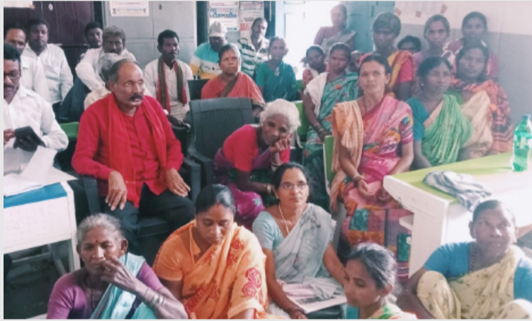
మే 15 (హంసకలం వార్డు)