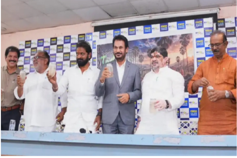
-సోమాజిగూడ ప్రెస్ క్లబ్ లో మీడియా సమావేశంలో మంత్రి పొన్నం ప్రభాకర్ కీలక ప్రకటన -సంస్కృతిలో అంతర్జాగ మైన గీత వృత్తికి, తాటి ఉత్పత్తులకు పూర్వ వైభవం -చిలుకూరు సమీపంలోని ఎక్స్ ప్లీరియం పార్కులో ఈ నెల 24న టూడే మ్యూజిక్ ఫెస్టివల్ మే 15 (హాంసకలం వార్త)

తెలంగాణ సంస్కృతిలో అంతర్జాగమైన గీత వృత్తికి, తాటి ఉత్పత్తులకు పూర్వ వైభవం తీసుకురావడమే లక్ష్యంగా ప్రభుత్వం కృతనిశ్చయంతో ఉందని రవాణా, బీసీ సంక్షేమ శాఖ మంత్రి పొన్నం ప్రభాకర్ స్పష్టం చేశారు. తాటి కల్లు, నీరాను కేవలం పానీయాలుగా కాకుండా ప్రకృతి ప్రసాదించిన ఔషధాలుగా ప్రజలకు చేరువ చేసేందుకు రాష్ట్ర ప్రభుత్వం ప్రత్యేక కార్యచరణను సిద్ధం చేస్తోందని