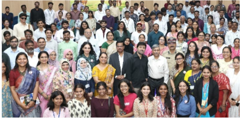
మే 15 (హంసకలం వార్డు)