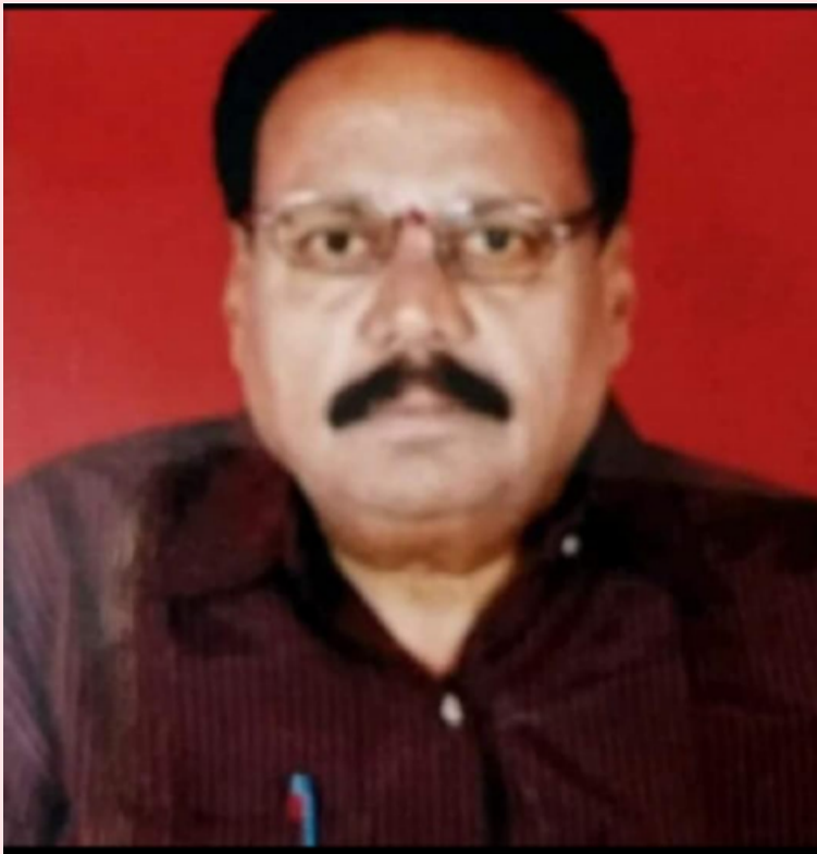
మే 15 (హాంబె కలం వార్డు)

సౌత్ టీడీపీ గేటు నుంచి సందర్శకులను మధ్యాహ్నం 3 గంటల నుంచి 5 గంటల వరకు అనుమతి పాసులు జారీ చేసే కేంద్రం నుంచి లోపలకు చేరుకోవడానికి అర కిలోమీటర్ల దూరం మండుబెండల్లో అర కిలోమీటర్ల దూరం నడక సచివాలయానికి ప్రజలు రావాలంటేనే భయపడుతున్న పరిస్థితి ఎండలతో సెగలుగకూతున్న ప్రాంగణంలోని వాహనాలు ఏసీల నుంచి వెలువడే ఎక్స్ ట్రా వేడితో ప్రాంతమంతా నిప్పుల కుంపట ఉద్యోగులకు తప్పని పరిస్థితి. సందర్శకులు ముందు వెనుక ఆలోచించే పరిస్థితి. తెలంగాణకాంగ్రెస్ ప్రభుత్వం