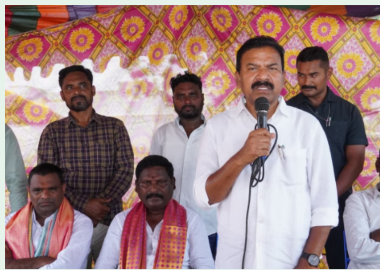
మే 17 ( హంసకలం వార్డు )

-కార్యకర్తల ప్రచారకర్తలు కావాలి -ఎమ్మెల్యే దాక్షర్ కష్టంపల్లి