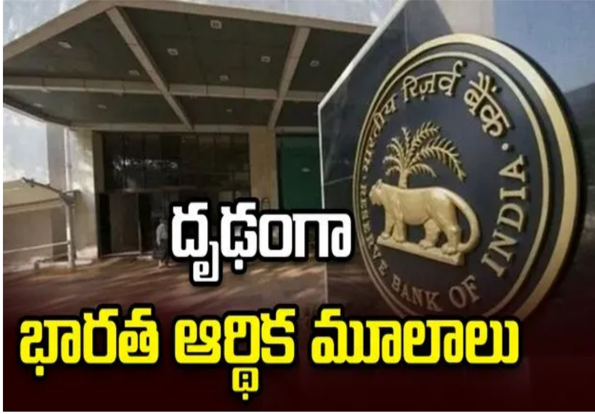
దృఢంగా భారత ఆర్థిక మూలాలు

ఇంటర్నెట్ డెస్క్: అంతర్జాతీయ అనిశ్చితులతో సవాళ్లు ఎదురవుతున్నా భారత ఆర్థిక రంగ మౌలిక అంశాలు దృఢంగా ఉన్నాయని ఆర్బీఐ తన తాజా వార్షిక నివేదికలో పేర్కొంది. ఈ ఏడాది దేశం అభివృద్ధి పథంలో పయనిస్తుందని చెప్పింది. ఈ మేరకు శుక్రవారం భారత రిజర్వ్ బ్యాంకు వార్షిక నివేదికను విడుదల చేసింది. నివేదికలోని వివరాల ప్రకారం, కార్పొరేట్ రంగం, బ్యాంకింగ్ రంగం లాభాల్లో ఉండటంతో పాటు మౌలిక వసతుల కల్పనకు భారత్ పెట్టుబడులు వెచ్చిస్తుండటంతో ఈసారి అభివృద్ధికి ధోకా ఉండదు.