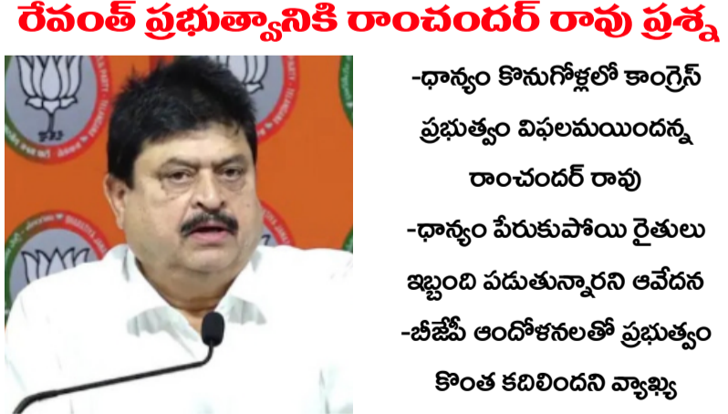
రేవంత్ ప్రభుత్వానికి రాంచందర్ రావు ప్రశ్న -ధాన్యం కొనుగోళ్లలో కాంగ్రెస్ ప్రభుత్వం విఫలమయిందన్న రాంచందర్ రావు -ధాన్యం పేరుకుపోయి రైతులు ఇబ్బంది పడుతున్నారని ఆవేదన -బీజేపీ ఆందోళనలతో ప్రభుత్వం కొంత కదిలించని వ్యాఖ్య హంసకలం వార్త: తెలంగాణలో ధాన్యం కొనుగోళ్ల ప్రక్రియలో ముఖ్యమంత్రి రేవంత్ రెడ్డి నేతృత్వంలోని కాంగ్రెస్ ప్రభుత్వం పూర్తిగా విఫలమైందని, రైస్ మిల్లర్లతో కుమ్మక్కైందని తెలంగాణ రాష్ట్ర బీజేపీ అధ్యక్షుడు రాంచందర్ రావు తీవ్రస్థాయిలో ధ్వజమెత్తారు. ఢిల్లీలో ఏర్పాటు చేసిన మీడియా సమావేశంలో మాట్లాడిన ఆయన.. రాష్ట్రంలో కొనుగోళ్ల సాగుతున్న తీరుపై తీవ్ర ఆసంకృతిని వ్యక్తం చేశారు. "చివరి గింజ వరకు కొనుగోలు చేస్తామని నాడు రేవంత్ రెడ్డి హామీ ఇచ్చారు. మరి ఇప్పుడెందుకు ఈ నిర్లక్ష్యం?" అని రాంచందర్ రావు ప్రశ్నించారు. రాష్ట్రవ్యాప్తంగా రోడ్లపైనే ధాన్యం కుప్పలు తెప్పలుగా పేరుకుపోయి రైతులు తీవ్ర ఇబ్బందులు పడుతున్నారని ఆవేదన వ్యక్తం చేశారు. కాంగ్రెస్ ప్రభుత్వం కావాలనే కొనుగోళ్లను ఆలస్యం చేస్తోందని, దిగుబడికి సంబంధించిన సరైన గణాంకాలను కూడా కేంద్ర 2లో..