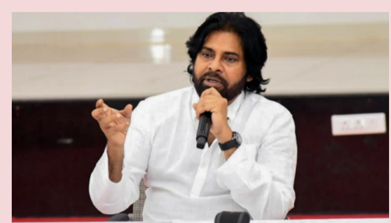
హంసకలం వార్త: హైదరాబాద్లో పవన్ కల్యాణ్ సభకు అనుమతి నిరాకరణ జూన్ 2న ఆవిర్భావ వేడుకల ధృవ్యాభివృద్ధి కారణాలు చూపిన పోలీసులు 'జనసేన సాధక్ సమ్మేళనం' పేరుతో సభకు ప్రణాళిక ఈ సభపై తెలంగాణలో కొనసాగుతున్న రాజకీయ చర్చ