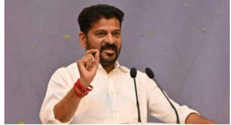
కొమురంబీమ్ జిల్లాలో సీఎం పర్యటన కొరారి గ్రామంలో ఇందిరమ్మ ఇళ్ల గృహప్రవేశంలో పాల్గొన్న సీఎం రెండో విడత ఇందిరమ్మ ఇళ్ల ప్రారంభోత్సవానికి పైలాన్ ఆవిష్కరణ

నెల రోజుల్లోనే ఇందిరమ్మ ఇల్లు కట్టుకునేలా కొత్త సాంకేతికత తీసుకువస్తాం